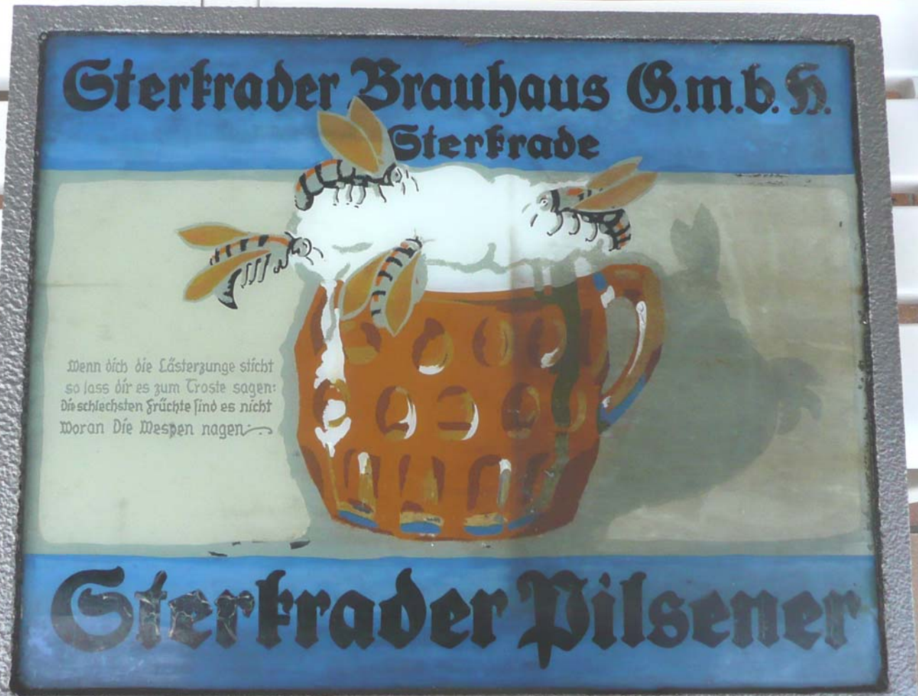
Sterkrader Meininghaus-Bier 1908 - 1955