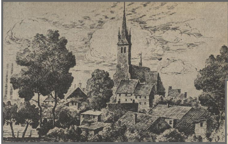
Blick vom Reinersbach zur Herz-Jesu-Kirche am Postweg

Die Zeichnungen entstanden in den 50er Jahren und zeigen Motive um die Wende des 19/20. Jhdt.