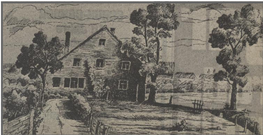
Sustmannshof im Reinersbachtal