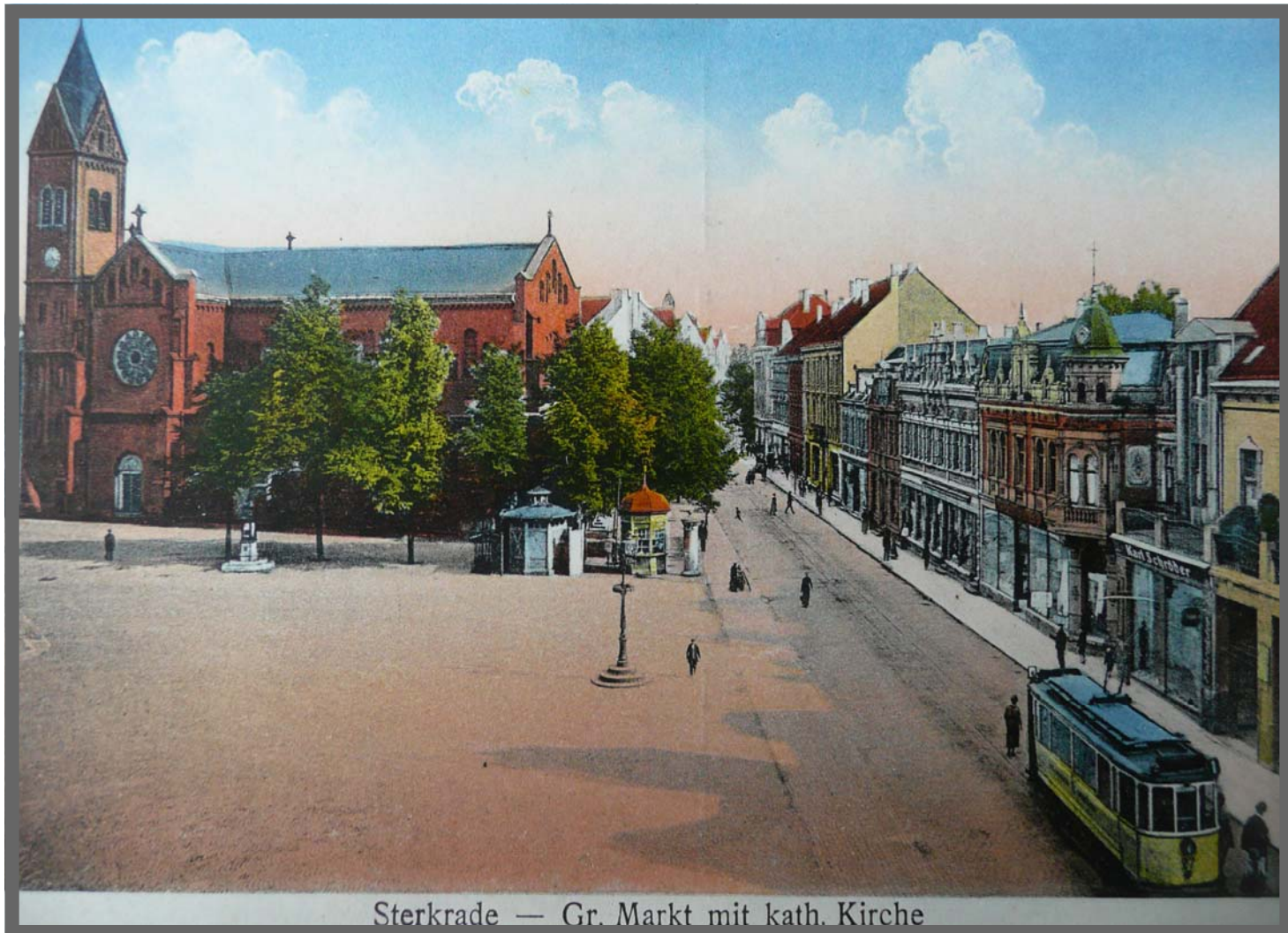
Sterkrade — Gr. Markt mit kath. Kirche

1912 Sterkrader Großer Markt mit vorbeiführender Marktstraße, nach 1929 Steinbrinkstraße. Neben dem Zeitungskiosk das erste öffentliche Pissoir (Café Wellblech).