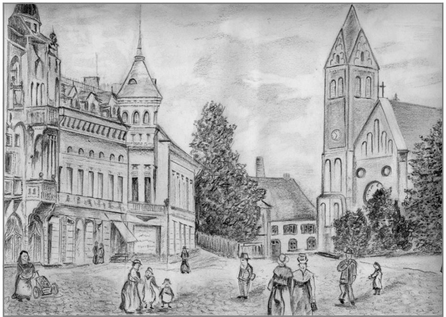
Sterkrader Großer Markt mit Clemenskirche um die Jahrhundertwende