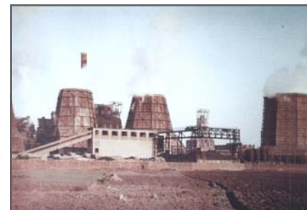
Kraftwerksanlage Zeche Sterkrade 1897 - 1996