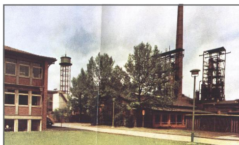
Teerdestillation Zeche Sterkrade 1925 - 1966