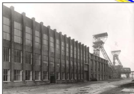
Schalt- und Maschinenhaus Zeche Sterkrade