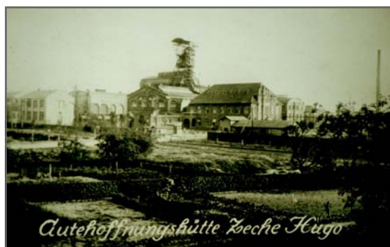
Zeche Hugo-Haniel 1895 - 1993