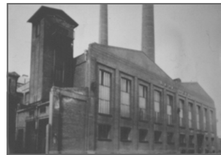
Kraftwerk der Zeche Sterkrade