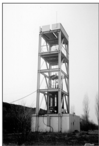
Letztes Fördergerüst Zeche Hugo-Haniel