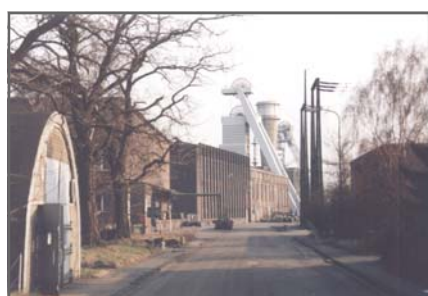
Straße durch die Zeche Sterkrade