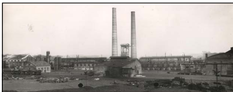
Kokerei Zeche Sterkrade 1897 - 1931