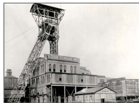
Zeche Sterkrade 1897 - 1931