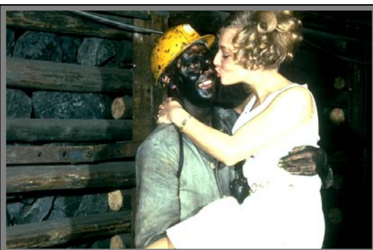
Bergmannsleiß - Bergmannslohn