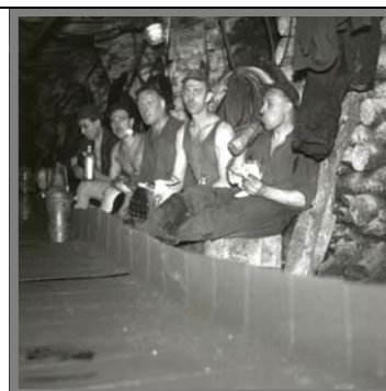
Dubbeln auf der Gezähekiste