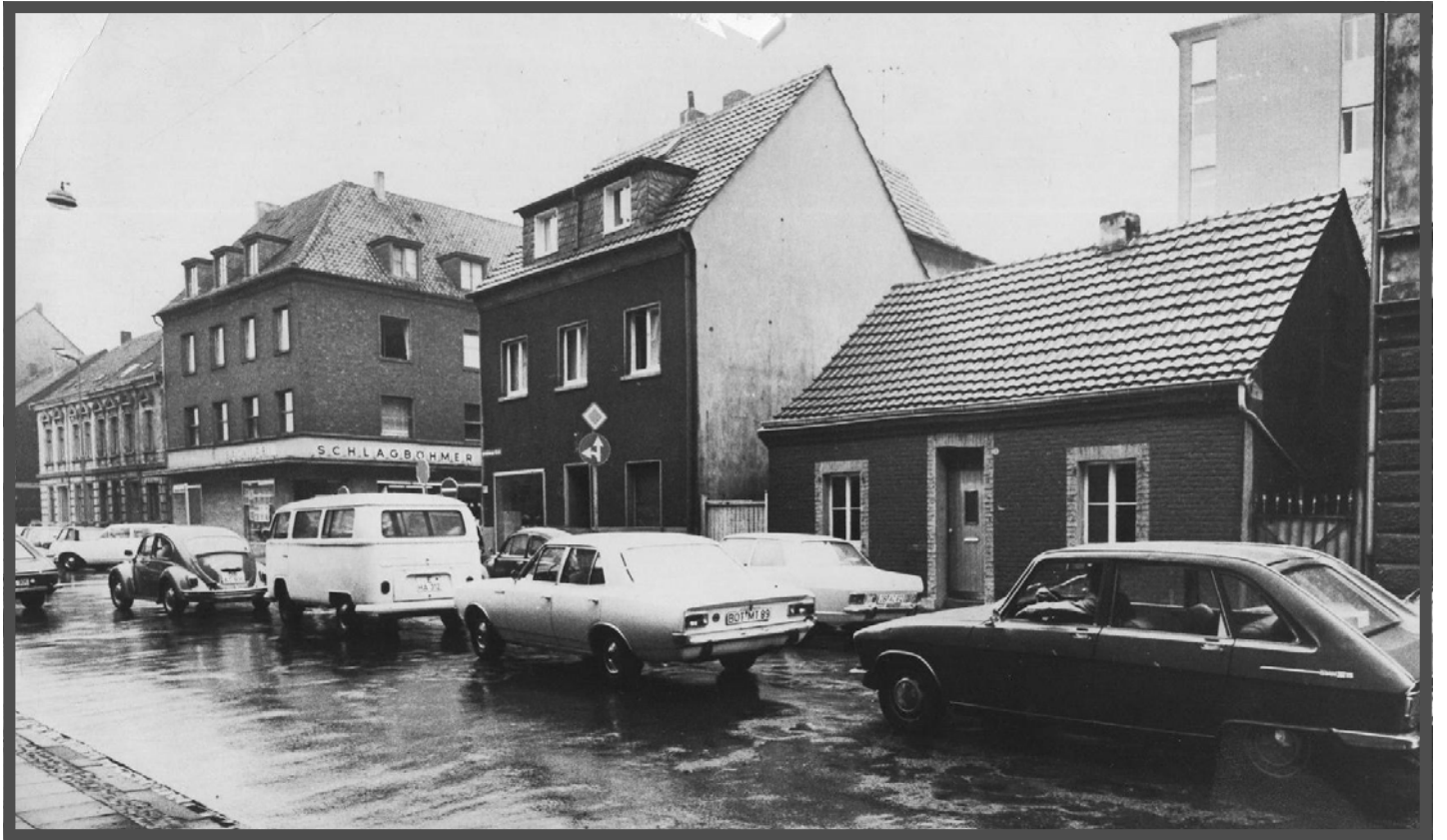
Brandenburger Straße im Jahr 1973 gegenüber dem Hochbunker. Heute Autobushaltestelle Neumarkt.