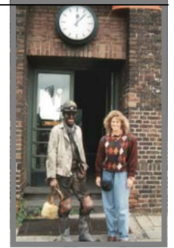
Vielleicht ein Lohnaustausch