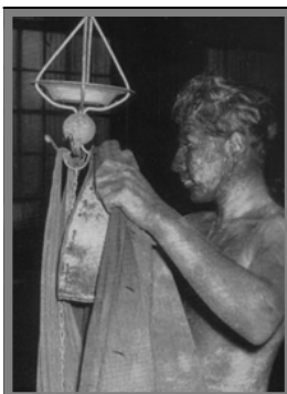
Bergmann am Kauenhaken

Auch viele Geschäfte, insbesondere die von Tante Emma, sehnten den Lohntag der Arbeiter herbei. An dem Tag konnten sie erwarten, dass die Hausfrauen ihre "Kreide" ausglich.