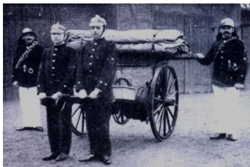
Freiwillige Feuerwehr Sterkrade um 1930