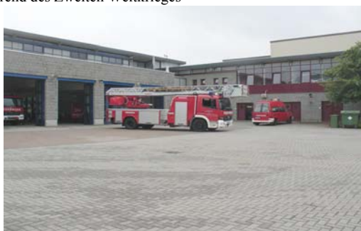
Neue Feuerwache an der Dorstener Straße seit 1996

Die erste organisierte Feuerwehr geht auf den römischen Kaiser Augustus zurück. Der wichtigste Ausrüstungsgegenstand der Feuerwehr war bis ins 19. Jh. der Eimer, der von Hand zu Hand gereicht wurde. Ein weiteres Werkzeug war und ist zum Teil noch heute die Axt, mit der man brennbare Materialien entfernte und Öffnungen schuf, durch die Hitze und Rauch aus brennenden Gebäuden abziehen konnten. Katastrophale Brände gab es immer wieder. 1733 vernichtete ein Brand in Holten 8 Wohnhäuser, 1 Brauhaus und 5 Scheunen. 1792 gaben sich die Holtener Bürger eine Feuerwehrordnung.