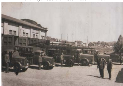
Berufsfeuerwehr vor und während des Zweiten Weltkrieges