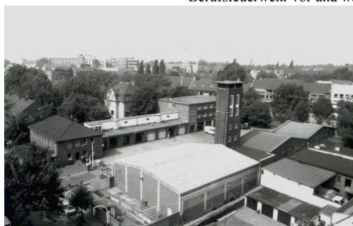
Feuerwache an der Eichelkampstraße 1955 - 1996