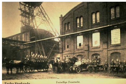
Zeche Sterkrade Freiwillige Feuerwehr