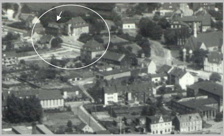
1965 Abbruch des Sensenhauses Ecke Dorstener-/Bertastraße Rechts: Das alte Pfarrhaus von St. Bernardus